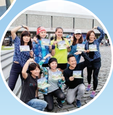
▶水月禪跑結合現代人的日常運動，年輕人呼朋引伴，一起來體驗動中禪。