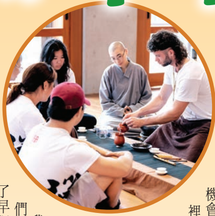
▶泡茶、倒茶、喝茶，每個動作都是禪的放鬆體驗。

我們總是習以為常地尋求舒適，因此，當既有的觀點和生活方式受到挑戰，很難保持開放的心去擁抱改變。來法鼓山之前，我無法預期會發生什麼，也不確定會得到什麼，然而，這趟旅行對於我的生活，確實產生了積極的影響。清晨的早課、禪坐，還有整個環境的平靜，打破了平日的生活狀態，走出了舒適圈。