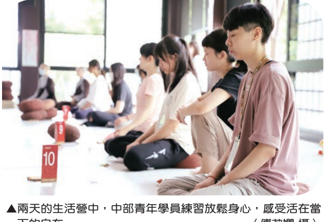
▲兩天的生活營中，中部青年學員練習放鬆身心，感受活在當下的自在。

「張素梅／高雄報導」煩惱都是由心生起，如何轉煩惱成菩提？紫雲寺於七月四日舉辦「找到心的自由」佛法講座。