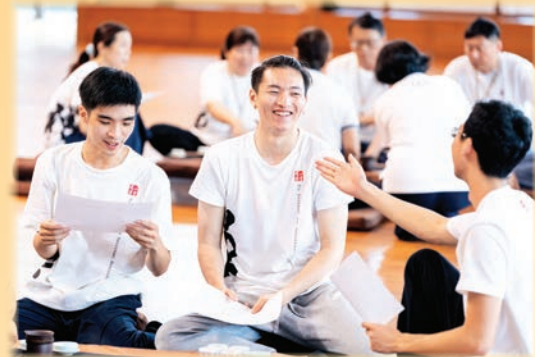
▲法鼓文理學院的茶禪活動，北美青年從公案中，體驗禪法的意趣。

6月28日，40位北美青年來到臺灣，展開一連七天的法鼓山巡禮。從天南寺、農禪寺、齋明寺，到總本山，北美青年有哪些感受和體驗？本期邀請學子們來分享這趟心旅程。