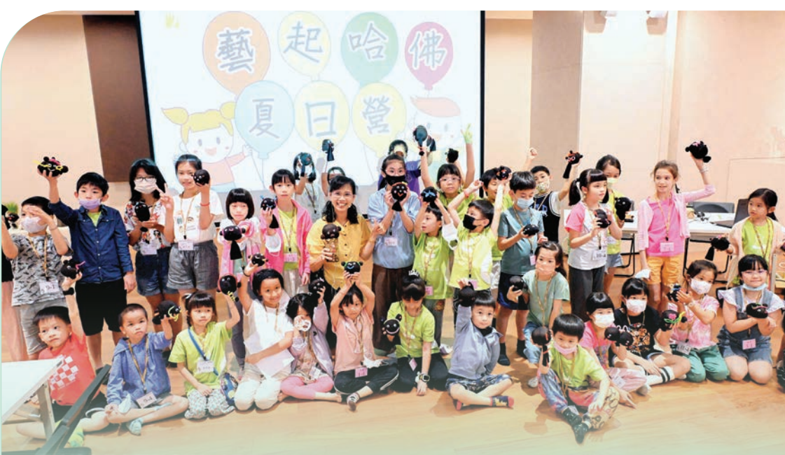
▲護法總會首次開辦「藝起哈佛夏日營」，以雲來別苑為主場，透過視訊連線全臺九個分會。