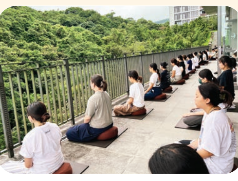
▲文理學院的層層疊疊，學員從大自然中，體會內心的寧靜。

我們總是習以為常地尋求舒適，因此，當既有的觀點和生活方式受到挑戰，很難保持開放的心去擁抱改變。來法鼓山之前，我無法預期會發生什麼，也不確定會得到什麼，然而，這趟旅行對於我的生活，確實產生了積極的影響。清晨的早課、禪坐，還有整個環境的平靜，打破了平日的生活狀態，走出了舒適圈。