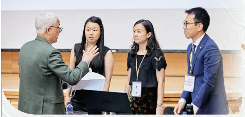
▲聖嚴思想研討會中，資深學者與青年學者齊聚互動交流，展現漢傳佛教學術研究的傳承與展望。