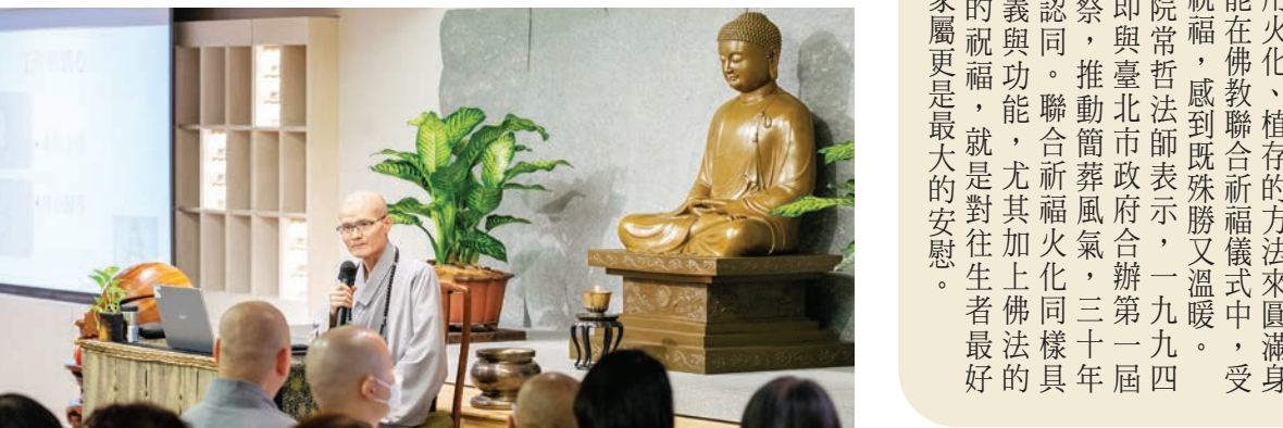
▲ 方丈和尚與香港信眾分享如何在生活中練習止觀法門，帶來幸福的生活。(香港道場提供)

勉勵大眾為人心帶來希望 「由於現代人生活步調急促，易受外界的影響，所以更須重視「心」的自在。」八日晚間的專題演講，方丈和尚指出，真正的幸福是身心健康，尤其是心情的平和與安定。日常生活中如何練習？「身在哪裡，心在哪裡；清楚放鬆，全身放鬆，這十六字箴言便是最好的止觀法門。」方丈和尚分享，無論行住坐臥，都可練習「一次只做一件事，讓自己保持清楚明白，可以得心應手。方丈和尚也鼓勵大眾隨時提起「阿彌陀佛」或「觀音菩薩」的聖號，就能幫助自己安心面對生命中的各種難關。 講座圓滿後，方丈和尚與現場大眾，並與大眾結緣「六度木尺書籤」，代表「福慧自在」的關懷與祝福，鼓勵人人「修福修慧，大眾平安健康；六度萬行，人人身心自在」，藉由積極實踐布施、持戒、忍辱、精進、禪定、智慧，為人心帶來無限希望，為社會帶來更新氣象。