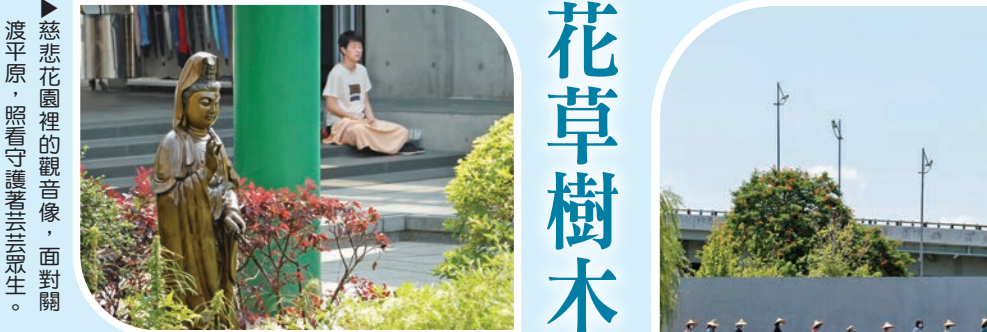
▲慈悲花園裡的觀音像，面對關渡平原，照看守護著芸芸眾生。

走入歷史建築「入慈悲門」所在的慈悲花園，細心的參訪者可能會發現：修剪過的樹木，外觀看似圓形，卻有許多未修剪的枝條，自在又不踴躍地伸展著。順應季節種植的花草，在繁盛凋萎、生生死死中，交相更迭。水池上的觀音像，面對著關渡平原，遠處是萬家燈火，彷彿正照看守護著芸芸眾生。