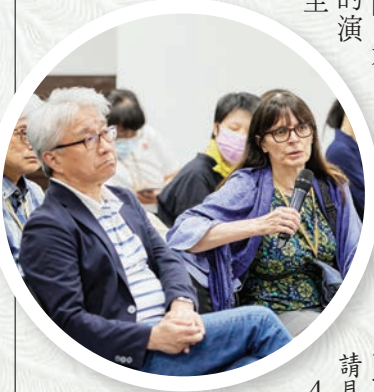
▲來自海外學者把脈實體交流機會，向發表人提問。