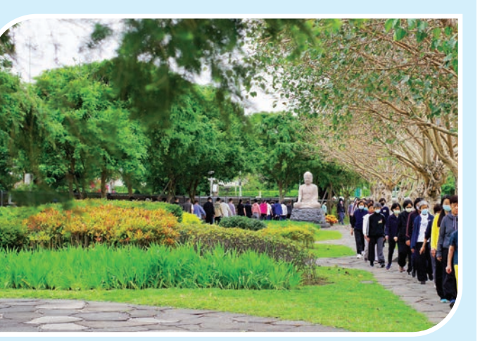
▲禪修公園栽植著應時的花草，走入其中，同時感受自然生命的更迭。

一般印象中，寺院多半給人遠離塵囂的寧靜之感，然而，位於臺北都會區的農禪寺，實際環境卻是「很熱鬧」。大門外圍牆外，緊鄰車水馬龍的大馬路與高架橋，大小車輛穿過而過，夜晚路燈織亮，宛若白晝。原有的六十五巷入口，巷弄裡各種音聲、烹煮的味道，交相雜錯。大殿旁、連廊外，不遠處的垃圾車氣味，不時也飄來湊熱鬧。