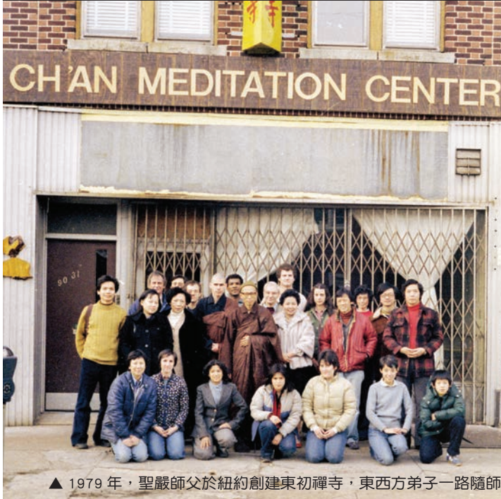
▲ 1979年，聖嚴師父於紐約創建東初禪寺，東西方弟子一路隨師學法護法。(本刊資料)