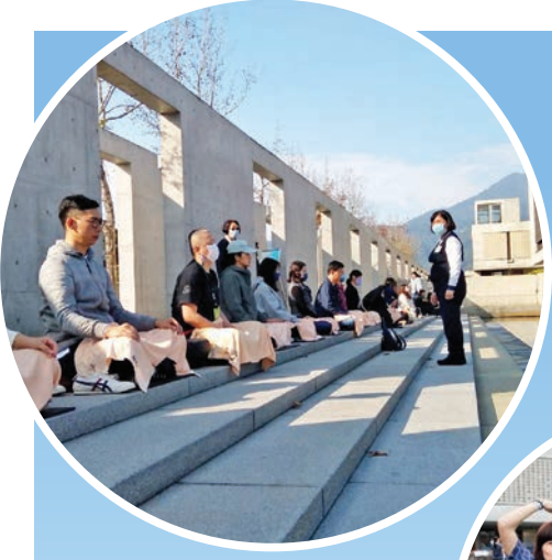
▲坐在水月池畔，尋禪而來的民眾靜下心，跟隨義工引導，體驗身心放鬆的感覺。

2012年底，聖嚴師父喻為「空中花，水中月」的水月道場落成，農禪寺從樸實的鐵皮建物群，蛻變成令人耳目一新的景觀道場，在喧囂的都會紅塵中，成為新一代信眾學佛修行的心靈家園。