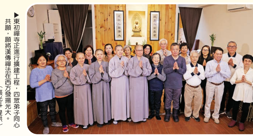
▲ 東初禪寺正進行擴建工程，四眾弟子同心共願，願將漢傳禪法在西方發揚光大。

《他的身影2》拍攝團隊於二〇二三年二月六日，與果元法師、演法法師一同搭機，由墨西哥飛往休士頓，再轉紐約。沒料到，迎接我們的是零下幾度的低溫。