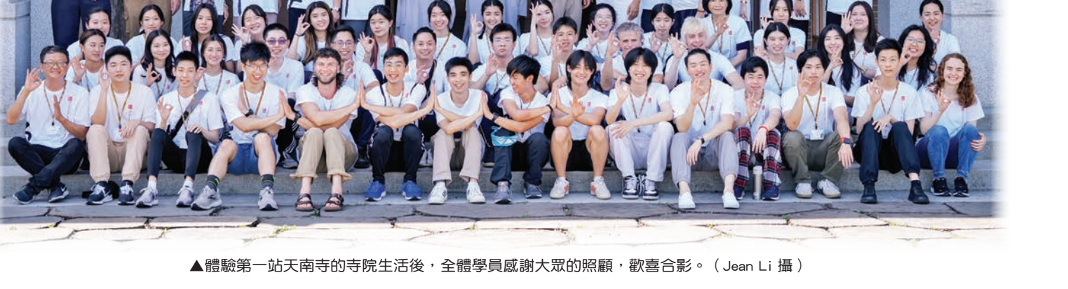
▲體驗第一天天南寺的寺院生活後，全體學員感謝大眾的照顧，歡喜合影。

我們服務、充滿愛的義工們。在法師引導下，我們參加了早課、朝山、植存儀式等，其中我最喜歡的是茶禪體驗。無法用言語形容我對每位參與者的感謝，我們的這趟旅程充滿了祝福，除了結交到新朋友、獲得充滿意義的回憶，還有新的人生指導。這趟旅程也提醒了我們，要成長自我，需要練習謙心、守紀律。如同聖嚴師父所說，當我們的慈悲愈深、智慧愈高，煩惱就愈少。回家後，我更珍惜眼前的生活，也感受到希望和自信，未來將持續探尋生命中的寧靜。