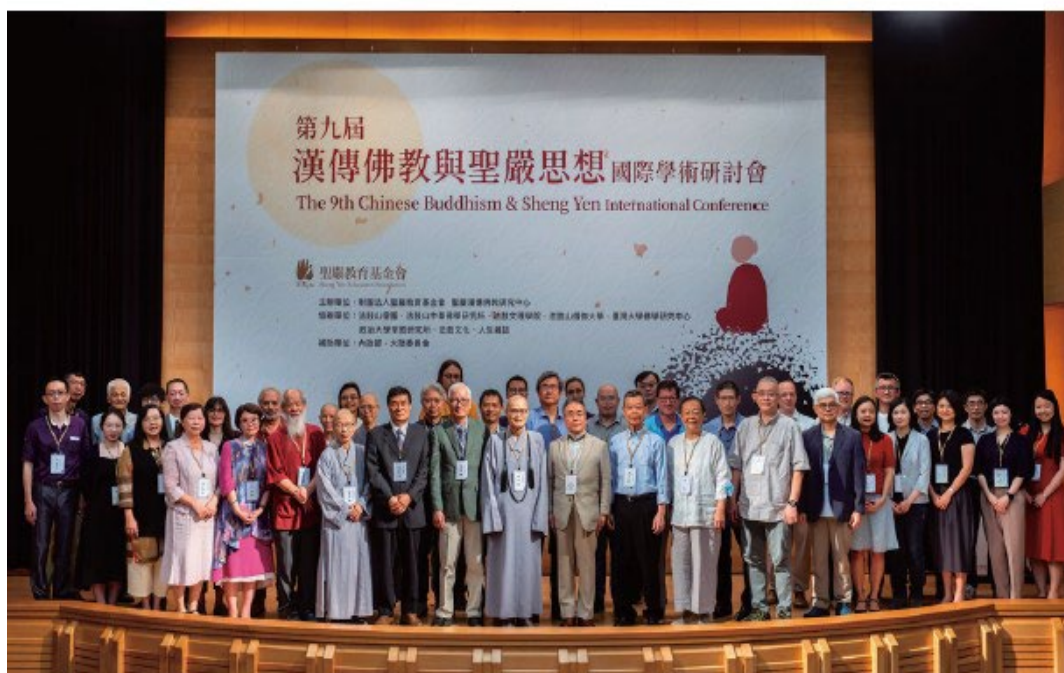
▲「第九屆漢傳佛教與聖嚴思想國際學術研討會」於疫情後實體、線上同步舉辦，國內外學者共聚一堂。