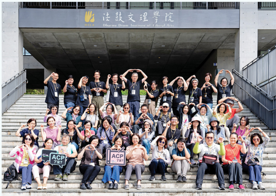
▲金山三寶體驗營的學員來自社會各界，一起探索心靈環保從個人到整體的實踐。(文理學院提供)

兩天兩夜的體驗營，打開學員的感官與心靈，從中體驗身體、心靈與自然環境的連結，同時以此基礎展開與他者的互動。透過這樣的活動，希望讓更多人關注心靈環保，並在日常生活中實踐心靈環保，為氣候變遷問題做出貢獻。