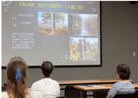
▲ 此次研討會有許多跨界的研究主題論文發表，展現漢傳佛教研究新面向。(李佳純 攝)