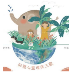
▲《圖解心靈環保》插圖