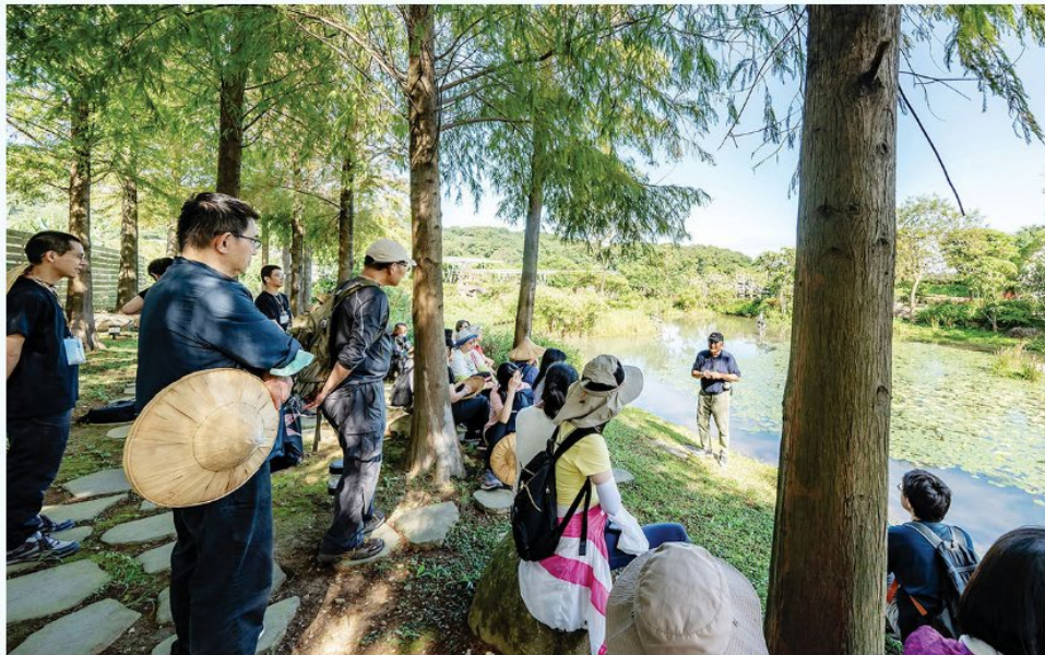
▲學員參觀朱銘美術館的生態池，體會生態共生、共存、共榮的巧妙。

【賴傳結／新北報導】十一月三至五日，聖嚴教育基金會與法鼓文理學院共同舉辦「氣候變遷心生活」系列活動之「金山掘鑿·覺況金山」金山三寶體驗營，三十位學員在文理學院、臺大醫院金山分院、朱銘美術館等團隊的協作陪伴下，透過美學、健康與心靈滋養等多元體驗課程，探索心靈環保實踐的另一種可能。