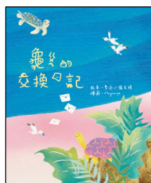
▲《龜龜的交換日記》封面