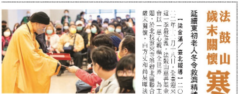
▲法鼓山僧團在寒冬中關懷長者，發放物資。

身心放鬆 平安自在 人，習慣不起煩惱，學習放下自我中心執著，放大自己的心量，以開闊的心量，去包容、去理解、去寬容。人，習慣不起煩惱，學習放下自我中心執著，放大自己的心量，以開闊的心量，去包容、去理解、去寬容。