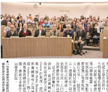
▲法鼓山舉辦佛學講座，探討禪修現代化。

法鼓山寒冬中溫暖全臺 歲末關懷 集結各界善心祝願 關懷全臺各地二千九百多戶家庭 「法鼓山」自一九八九年創辦以來，一直秉持著「以法鼓弘法，以僧團弘教」的宗旨，致力於弘揚佛法，利益眾生。在歲末之際，法鼓山特別舉辦了「歲末關懷」活動，集結各界善心，為全臺各地的貧苦家庭發放物資，送去溫暖。