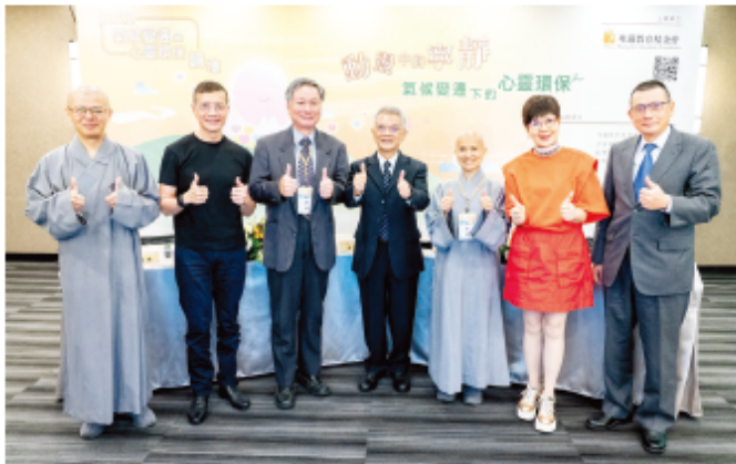
▲各界代表省思氣候變遷的前因後果，呼籲大眾從心出發，實踐四種環保，讓世界產生正向循環。