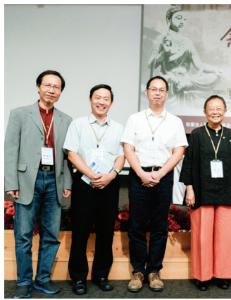
「聖嚴師父數位典藏暨如來藏思想」從師父手稿、筆記等第一手史料中，發掘師父思想價值的更多可能。

數位小組除了徵集師父的文獻資料，更於二〇一六年至日本東京、北平、探訪師父友好友誼、進行口述歷史，並獲贈許多寶貴的史料紀錄，包括桐谷征一先生所贈與、師父於一九七五年請求博士論文審核報告書正本。另外，《法鼓全集》已收入《聖嚴法師年譜》，並將年譜提及的著作、事蹟與全集連結，未來將