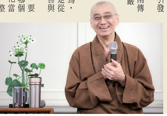
繼程法師以自己學佛修行的歷程，說明自我轉化的歷程。

的歷程，因為學佛修行，引發了心理的轉化。 出家後，法師開始接觸南傳的禪法，再到臺灣參加聖嚴師父主持的三期禪七，接著有一千日閉關用功，體會到「佛法不是外在的，而是從內心流露出來的」。在學佛的每個階段不斷薰習，改變外在的行為，也轉化內在的狀態，這就是從量變走向質變的過程，讓善與清淨的力量不斷增長。 法師強調，學佛過程中，要不斷反省自己在四悉檀的哪個階段，在層層深入的轉化當中，漸漸從事相通達理相，整個身心便會進入徹底質變的階段，即是「轉迷為悟、轉識成智、轉凡成聖、轉煩惱為菩提」的「不二」境地。此時就能體悟到事與理都是依空而立，空即是清淨，是我們本然性智慧的顯現，也就能在「行深般若波羅蜜多時，一照見五蘊皆空，真正地「度一切苦厄」了。