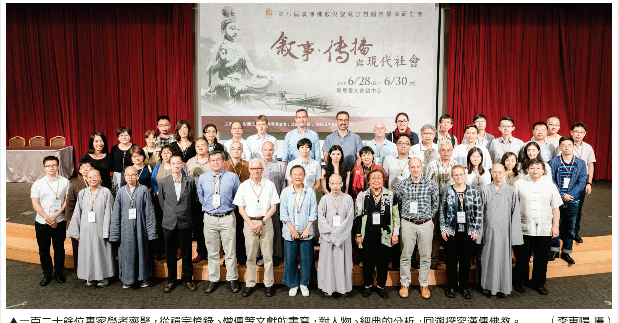
▲一百二十餘位專家學者齊聚，從禪宗燈錄、僧傳等文獻的書寫，對人物、經典的分析，回溯探究漢傳佛教。

【釋演化／臺北報導】六月二十八日至三十日，由聖嚴教育基金會主辦的「第七屆漢傳佛教與聖嚴思想國際學術研討會」，於集思臺大會議中心展開，以「敘事、傳播與現代社會」為主題，參與專家學者約一百二十餘位，發表六十五篇論文，包含三場專題演講，三場佛教與不同專業領域對話的論壇，以及三個專題研討，從禪宗燈錄、僧傳等佛教文獻的書寫，以及學者們對人物、經典、儀軌的分析，回溯探究漢傳佛教內涵的建構，與樣貌的形塑。