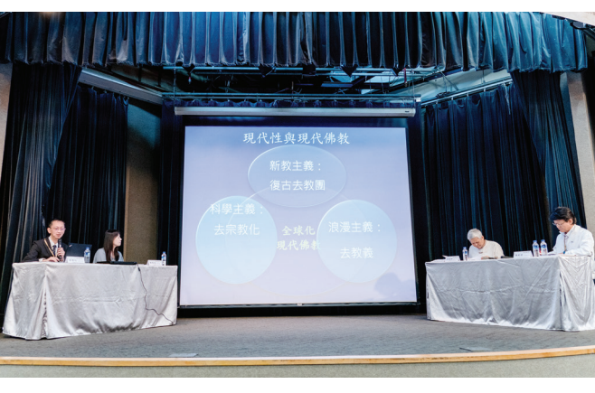
師父以天台融攝各宗的包容性、消融性，強調回歸佛陀本懷，推出全人類共同需要的佛教。