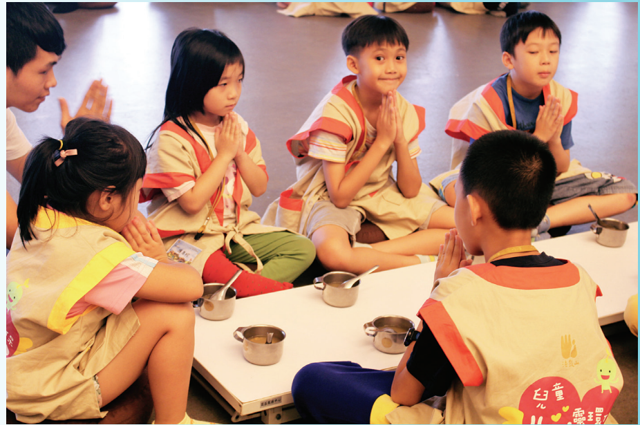
▲基隆、新店小菩薩用點心前，學習以感恩心做供養。