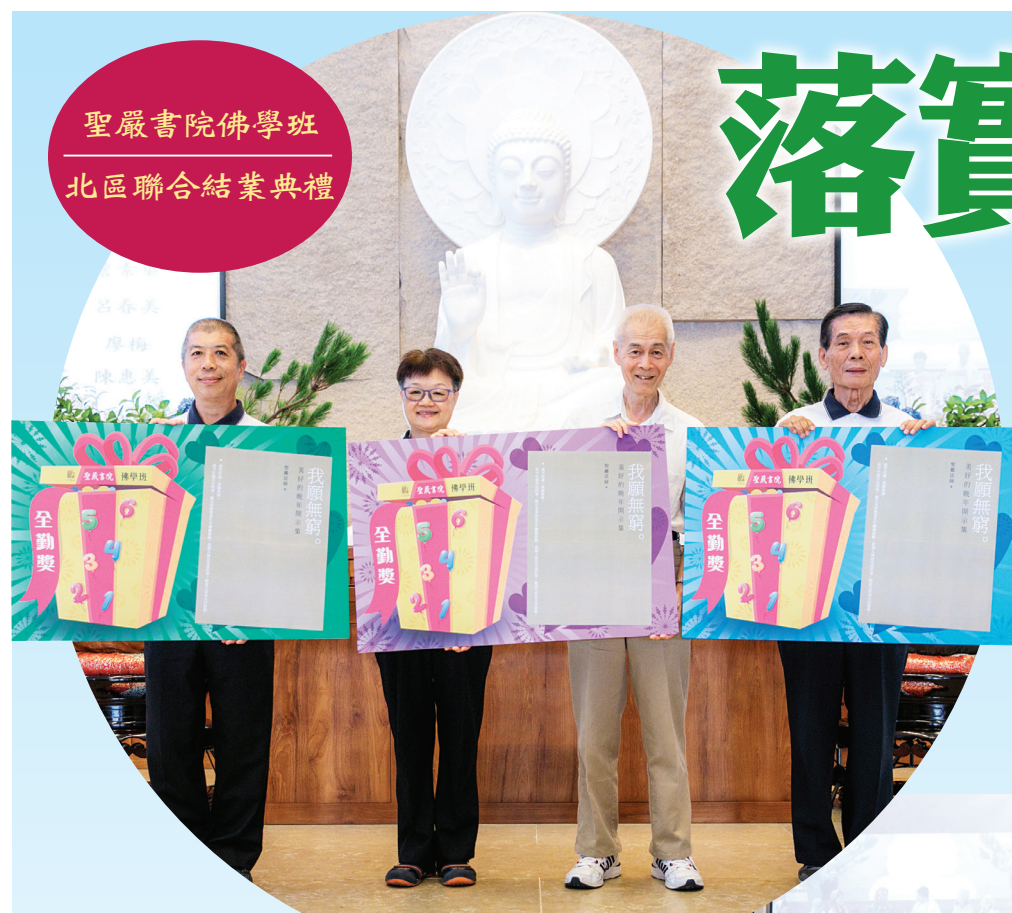
聖嚴書院佛學班 北區聯合結業典禮