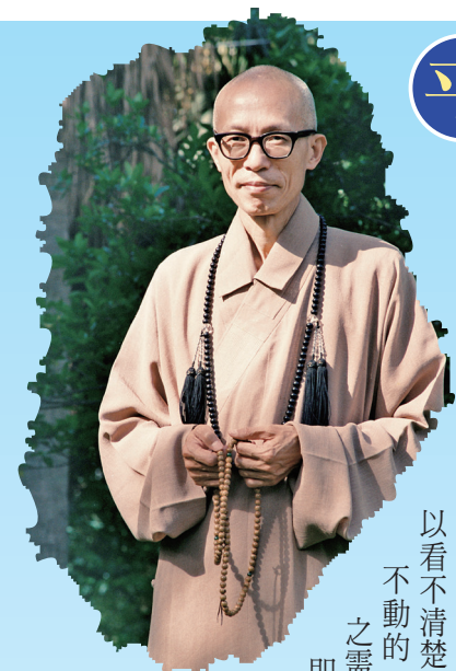
(摘自《禪的生活》原篇名《事與心》)

當我們用心到心與事合而為一時，已經是心外無事，事外無心，這種情況才是真正修行得力的開始。通常，人們都是處在事情和心分離的狀態下，所以有煩惱，以致無法了解自己，無法真正的了解他人。如果心和事合而為一，我們對於自己是清清楚楚的，對環境也是非常清楚的。 事入心中 心事合一 通常用海作比喻，海面無浪是不可能的，除非海變成琉璃、水晶，才不被風吹成浪。心亦如此，若未穩定堅固，必會受到境界的事所擾亂。凡夫的心就像海面的水，外境就像風，只要風一動，水就起波浪，一起波浪，它就糊塗混亂了。 動你的心，使事進入你心中，目的是心與事合而為一，乃至心與事雙亡。 諸位可知道？成佛之後的人，是心與事合一，抑是心與事雙亡？從佛的觀點而言，是無我無物無眾生的，當然也是無心無事的。心不住於過去、現在和未來，便是無心；無我相、無人相等等，便是無事。但是佛以無緣大慈救眾，故不住三際而有心的活動，此心不是主觀或客觀的我，而是隨物應化的悲智，如明鏡本身無物無影，但能胡來胡現、漢來漢現，你是什麼你要什麼，佛的悲智之中就現出什麼而給你什麼，且能一時頓現十方三世的一切事物。 佛心不動 悲智雙運 這可以拿照相機的鏡頭作比喻：照相機拍照，鏡頭不能動，一啪一聲，照出來的相片才清楚；如一面照一面動，鏡頭一定是模糊的，拍出來的照片就不會清晰。再拿我們人的眼睛跟照相機的鏡頭作比較，請問：在同一個時間之內，在眼睛視線所及的範圍內，你能清清楚楚地把每一個事物的所有形像，都攝入印象中嗎？不可能。 在座諸位有好幾十個人，我一眼可以看清楚每一個人的表情嗎？沒辦法啊！我一眼只能看到一部分人的表情。可是照相機的鏡頭，能在一剎那之間，將鏡頭所及範圍內的一切攝入無遺。兩者為什麼有這樣的不同？這是因為我們的眼睛在視物的時候，加上我們的心，我們的心在動，所以看不清楚。而佛心是如如不動的，故能因緣眾生之需要而給予救濟，即所謂的「無緣大慈，同體大悲」。(完)