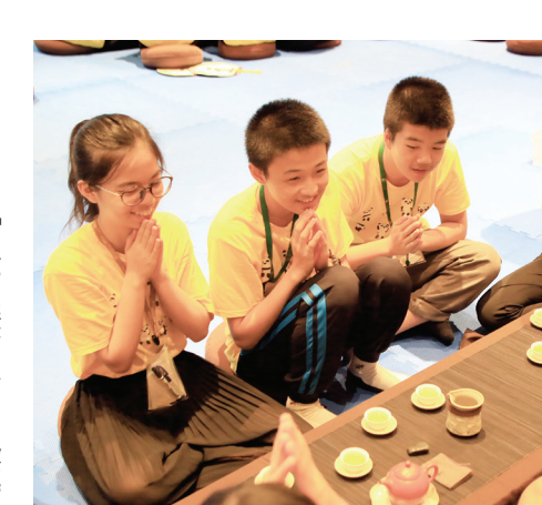
▲生命美學營中，學員彼此關懷交流，探索自心。